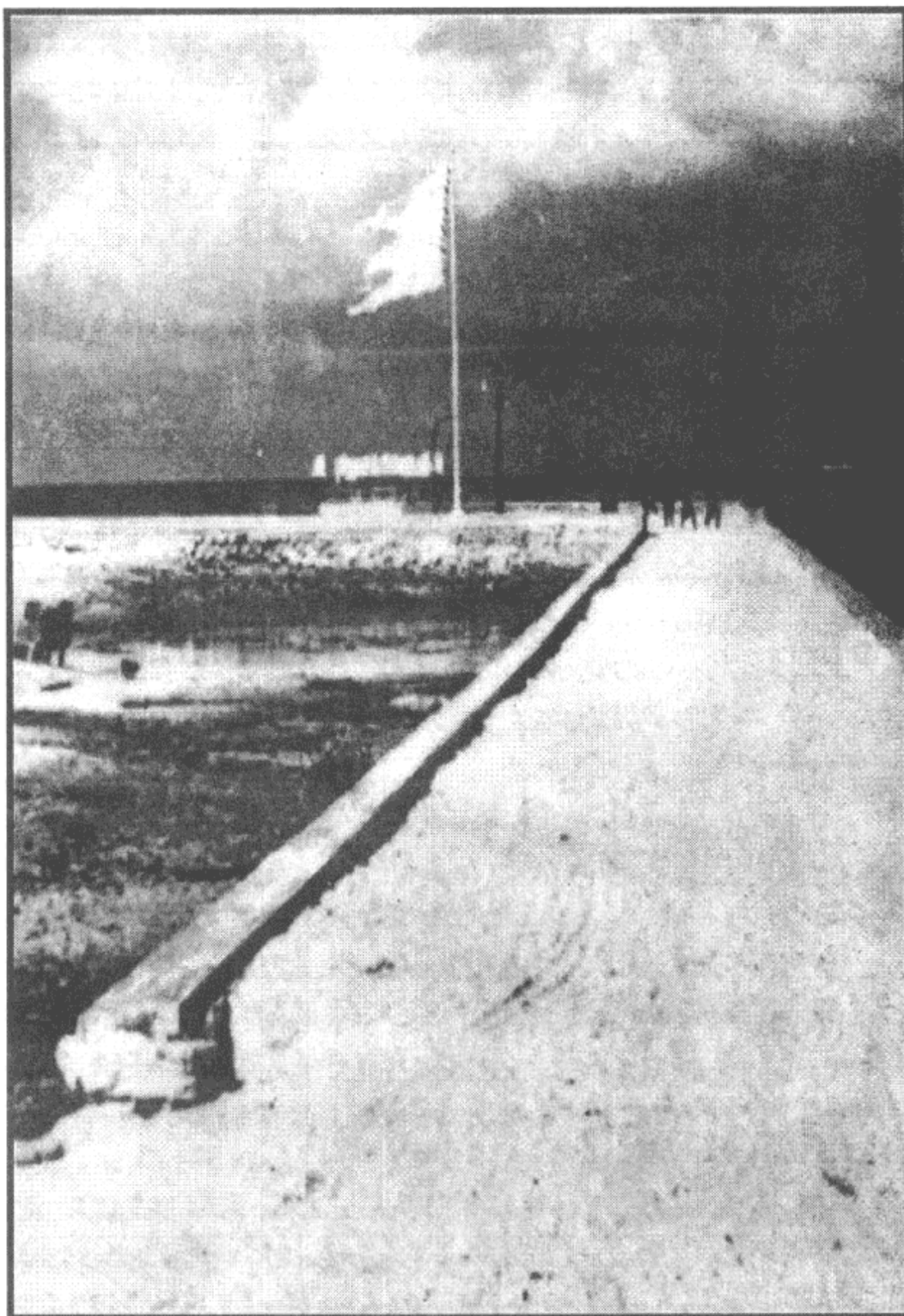
مَدِیْنَةُ مَدِیْنَةُ مَدِیْنَةُ (1950 ح. 10 م.)